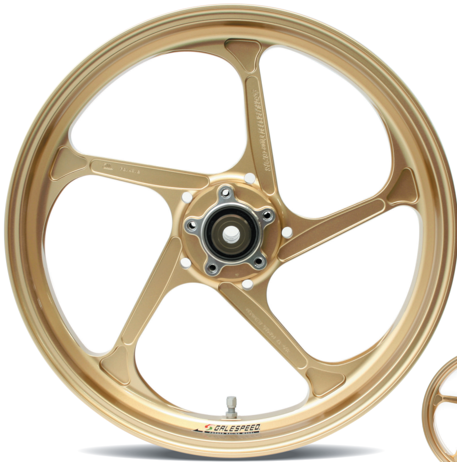
Mono Arm Rear Wheel