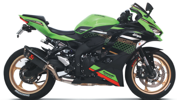
Ninja ZX-25R 21

鍛造で強度を増したアルミニウムを極限まで切削し軽量化。「剛性」と「軽さ」を両立させています。