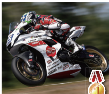
#25 Dominic Doyle選手