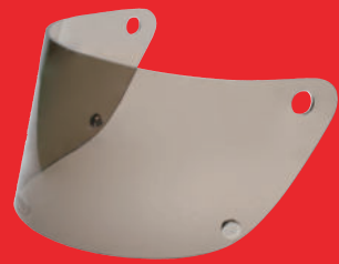
スモークシールド 税込価格 ¥5,280