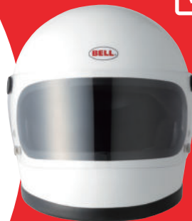
STAR II 税込価格 ¥39,600