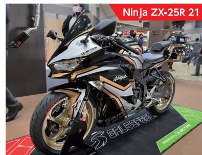
Ninja ZX-25R 21