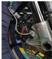
フロント2Pラジアルキャリパー