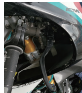
ブレーキマスターシリンダーVRC