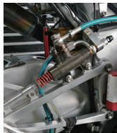
リアマスターシリンダー