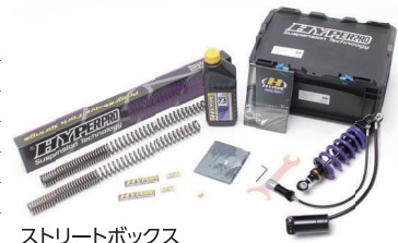
ストリートボックス