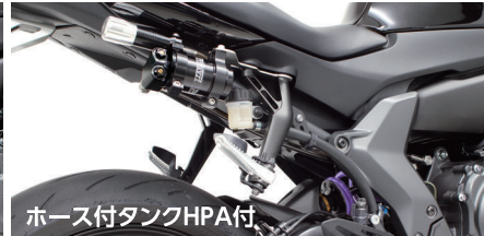
ホース付タンクHPA付