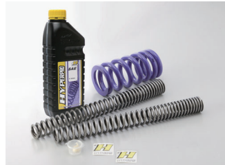
(フロントスプリング+リアスプリング)