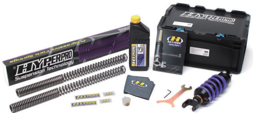
(リアショック+フロントスプリング)