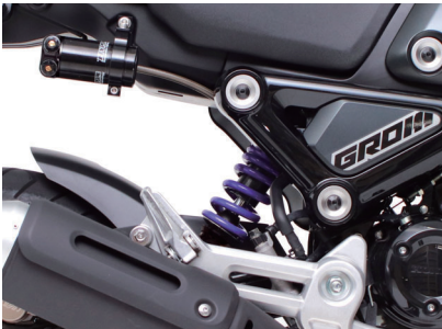
フロントスプリング