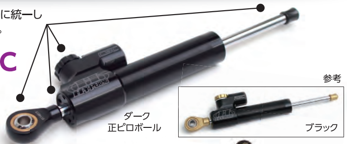
ダーク 正ピロボール