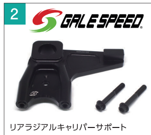
リアラジアルキャリパーサポート