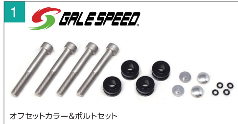
オフセットカラー&ボルトセット