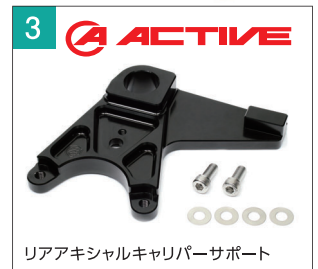
リアアキシャルキャリパーサポート