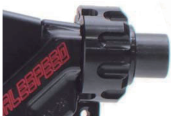
ワイヤー調整ダイヤル