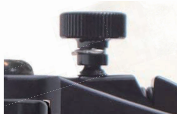
レバー開度調整機構