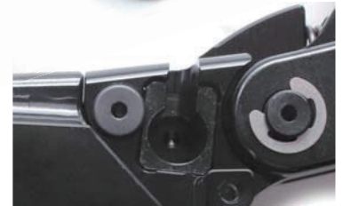
レシオアジャスター