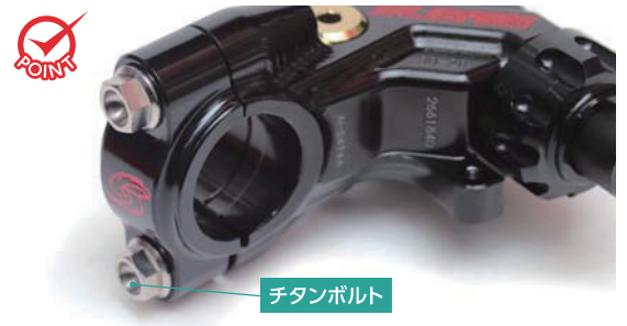
内側にスロット加工を施した二点クランプで固定力をより高めます。