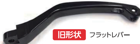
旧形状 フラットレバー