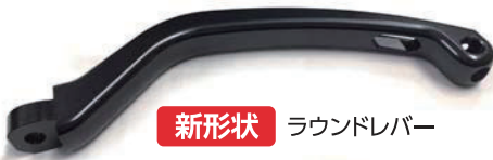
新形状 ラウンドレバー

弊社が取り扱うブランド「ゲイルスピード」のマスターシリンダー及びワイヤークラッチホルダーキットのレバー形状変更に伴い価格/品番/JANが変わります。