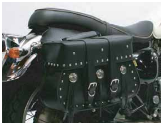
サドルバッグ取り付け例：バッグ本体は、本製品には含まれません