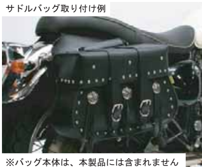
サドルバッグ取り付け例

※バッグ本体は、本製品には含まれません 装着サドルバッグ (アメリカンクラシック : 品番SB380)