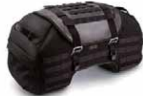
LR2テールバッグ(48L) ¥39,000(税抜)