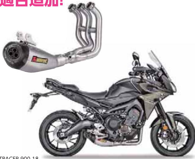
TRACER 900 18 RACING チタンサイレンサー