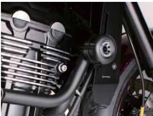
※サブフレーム(マットブラック)、同時装着カラーを併用