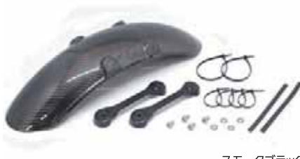
スモークブラック