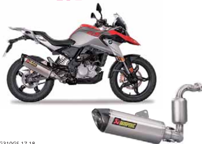
G310GS 17-18 RACING ステンレスサイレンサー