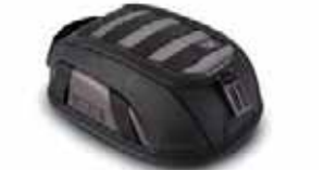
LT1タンクバッグ(3~5.5L) マグネット式 ¥12,000(税抜)