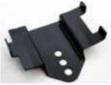
3つの取り付け穴で車体キーシリンダーに合わせた位置やお好みの位置で固定できます。