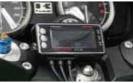
カラーは、アクティブ製デジタルモニター専用ステーにも取り付け可能です。