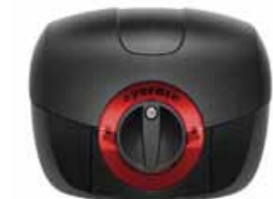
税込価格: ¥11,550 (本体価格: ¥11,000) サイズ: 32L 品番: EYE0632504 JAN: 707389