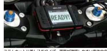
ステムナットに差し込むタイプ。画面が確認しやすい車体中央に取り付けできます。