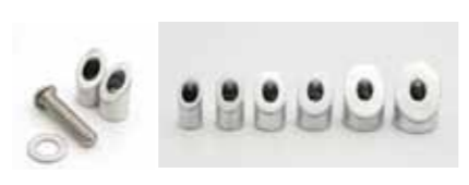
ステムナット内径に合わせた割りカラーを6サイズで展開。カラーのみの別売もラインナップ。