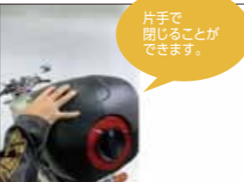
片手で閉じることができます。