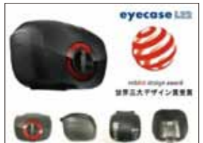
レッド・ドット・デザイン賞受賞!