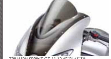
TRIUMPH SPRINT GT 11-12 ダブルバブル